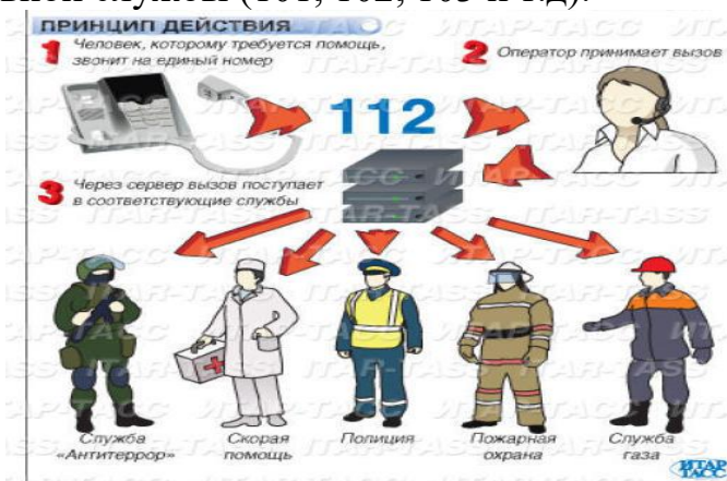
Рис. 1. Принцип работы «Системы 112»

вышеперечисленными дежурно-диспетчерскими службами, необходимо обеспечить информационное взаимодействие с Системой -112. При этом сохраняется возможность вызова экстренных оперативных служб посредством набора номера, предназначенного для вызова отдельной экстренной оперативной службы (101, 102, 103 и т.д).